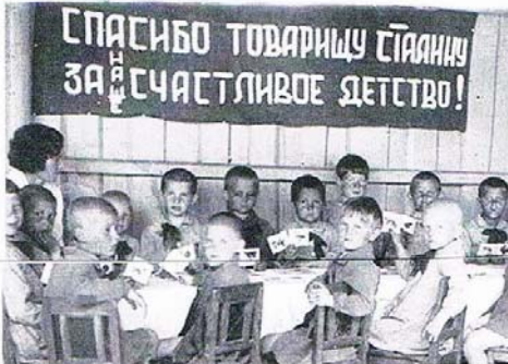
В детском саду (среди детей в пятый слева). Энгельс, 1938 г.

Этому способствовало и то, что в России стали складываться собственные кадры, а поставленные перед немцами задачи были в основном выполнены - окно в Европу, с чего начался Петр Первый, уже открыто, охраняли земли, и за чего их пригласила Екатерина Вторая, успешно освоены, теперь эти земли принадлежат самим. И немцы, в том числе и тех, кто в России оказался вместе с присоединенными в 18-м веке территориями (Прибалтика), стали вытес-