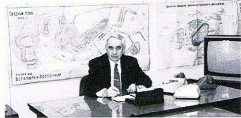
Проектная фирма «Карагандагипрошахт». Мой «рабочее место» в 1983-1996 гг.

жителями межгосударственных отношений России (СССР) и Германии, и это можно считать, главной причиной их дискриминации и в царское, и в советское время. И покал дискриминация напрямую зависел от характера этих отношений. А жестокость дискриминации была всегда инструментом советской системы, которая и с другими своими народами не особенно церемонилась – миллионы людей разных национальностей были репрессированы, раскулачены, проигнорированы и тюрьмы, а некоторые народы депортированы.