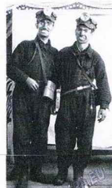
Только что из лагеря (в справа). Караганда, 1952 г.