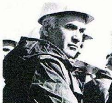
Лауреат государственной премии СССР. В Экибастуле, 1988 г.